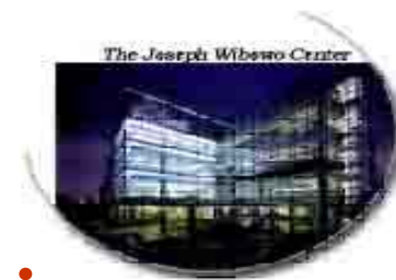
The Joseph Wibowo Center