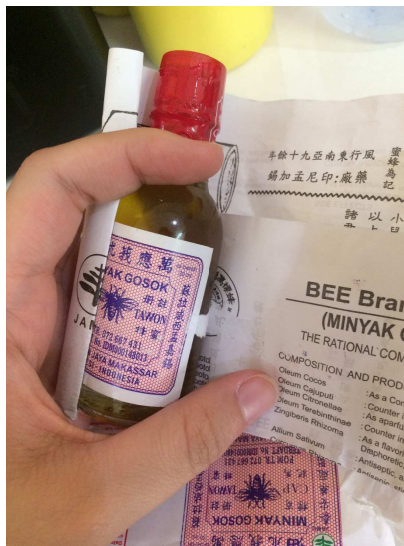
Gambar 1.5.3 Kemasan Minyak Gosok Cap Tawon