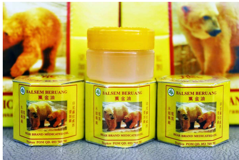
Gambar 1.6.3 Balsem Cap Beruang

Kemudian penulis melakukan analisa mengenai pengertian kompetitor itu sendiri. Kompetitor / pesaing adalah mereka yang mengejar sasaran pasar yang sama. Ada empat tingkat persaingan perusahaan dengan melihat hal-hal sebagai berikut;