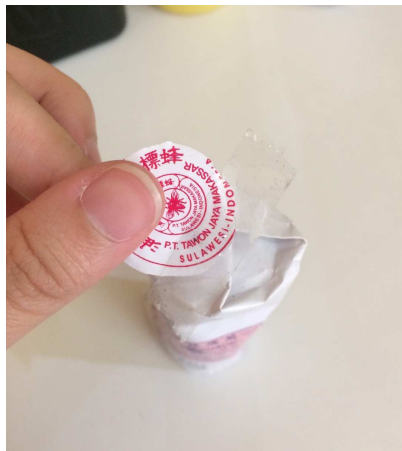
Gambar 1.5.1 Kemasan Minyak Gosok Cap Tawon