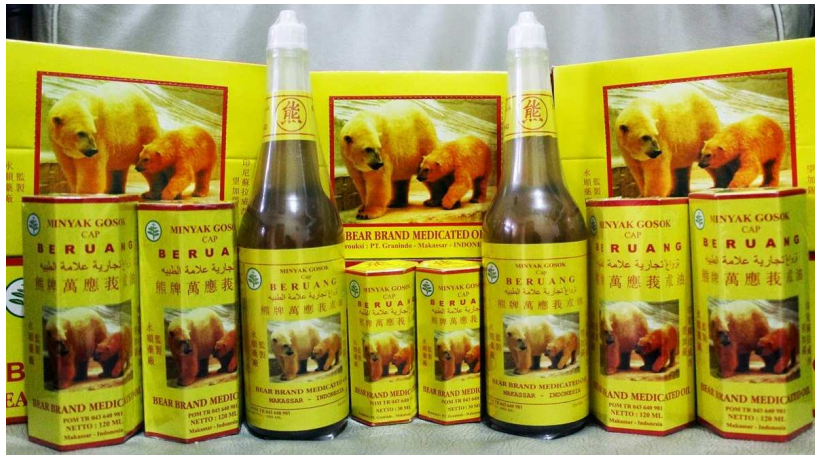
Gambar 1.6.2 Minyak Gosok Cap Beruang