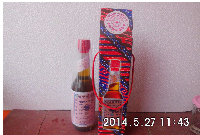
Gambar 1.2.2 Minyak Gosok Cap Tawon Tutup Merah