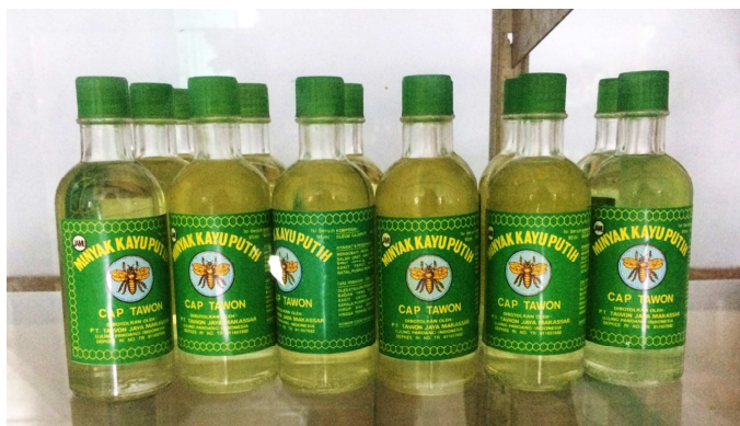
Gambar 1.3 Minyak Kayu Putih Cap Tawon

Minyak kayu putih berkhasiat mengurangi perih sakit perut, menghilangkan kembung, mengurangi rasa pusing kepala dan menghangatkan badan. Minyak kayu putih juga baik digunakan untuk balita setelah mandi untuk menghangatkan tubuhnya agar tak mudah masuk angin.