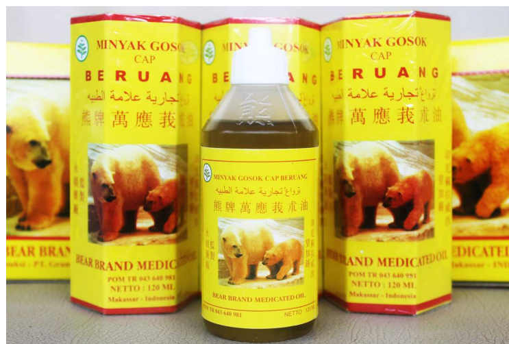
Gambar 1.6.1 Minyak Gosok Cap Beruang