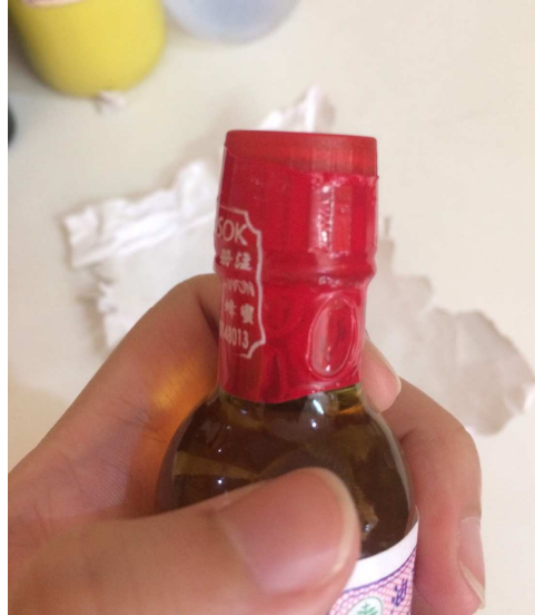
Gambar 1.5.4 Kemasan Minyak Gosok Cap Tawon