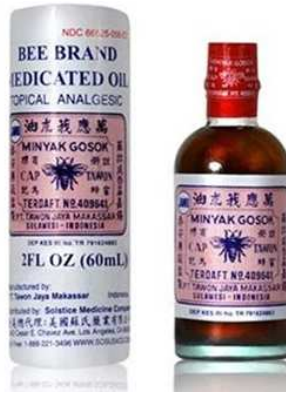
Gambar 1.1 Minyak Gosok Cap Tawon