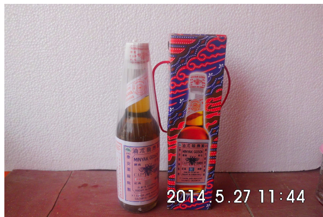
Gambar 1.2.1 Minyak Gosok Cap Tawon Tutup Putih