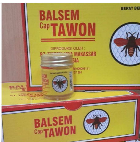
Gambar 1.4 Balsem Cap Tawon

Balsem adalah minyak kental yang biasanya digunakan untuk penyembuhan dan menenangkan, digunakan untuk penggunaan luar tubuh. Contohnya digunakan untuk kerokan disaat kita masuk angin, melegakan hidung yang tersumbat, sakit kepala, atau untuk meredakan bagian tubuh yang terasa pegal atau keseleo.