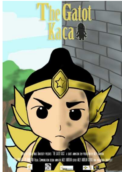
Gambar 5.5 Visualisasi Poster

Penulis mendesain poster film animasi pendek "The Gatot Kaca" dengan penggambaran sang Gatot Kaca kecil yang berada di dua dunia yang berlainan, dunia nyata dan dunia di dalam buku.