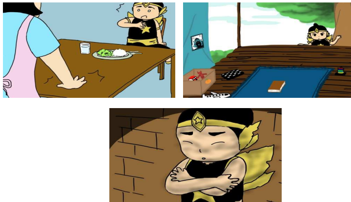
Gambar 5.4 Visualisasi Scene "The Gatot Kaca"

Beberapa scene yang terdapat dalam film animasi pendek "The Gatot Kaca" :