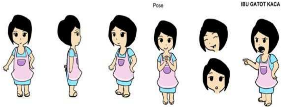
Gambar 5.2.2 Visual Ibu Gatot Kaca

Ibu Gatot Kaca digambarkan sebagai ibu rumah tangga biasa yang ceria dan penyayang. Warna yang dipakai adalah warna-warna biru muda dan pink agar menggambarkan sifatnya yang ceria.