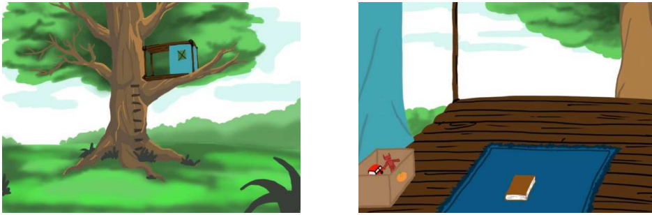
Gambar 5.3.2 Rumah Pohon Gatot Kaca kecil