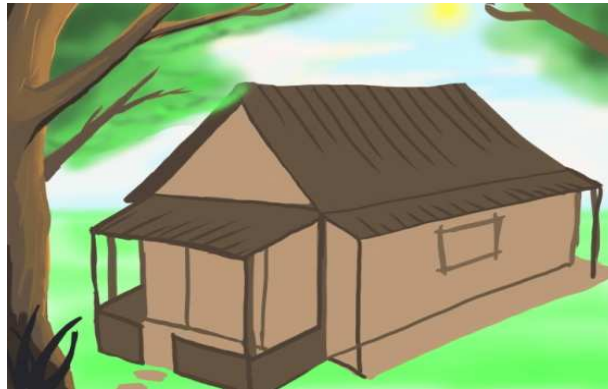
Gambar 5.3.1 Rumah Gatot Kaca kecil