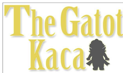
Gambar 5.1 Title "The Gatot Kaca"

Bayangan Hitam Gatot Kaca kecil menunjukkan visual penampakan dari sang Gatot Kaca kecil dan melambangkan kekelaman di dunia dalam buku ajaib.