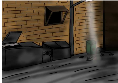
Gambar 5.3.3 Gang Gelap